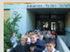
Johannes-Kullen- Schule Korntal

Zuffenhauser Straße 24 70825 Korntal-Münchingen Tel. 07 11/8 30 82-51/-50 Telefax 07 11/8 30 82-59 info@johannes-kullen-schule.de Private Schule für Erziehungshilfe im Verbund mit Hoffmannhaus und Flattichhaus in Korntal. In der Stammschule 14 Klassen in der Grund- und Hauptschule, fünf Förderklassen sowie je zwei Grundschulklassen an den Außenstellen in Bietigheim-Bissingen an der Waldschule und in Leonberg an der August-Lämmle-Schule. Sonderpädagogischer Dienst für Grund-, Haupt-, Real und Sonderschulen im Landkreis Ludwigsburg und im Altkreis