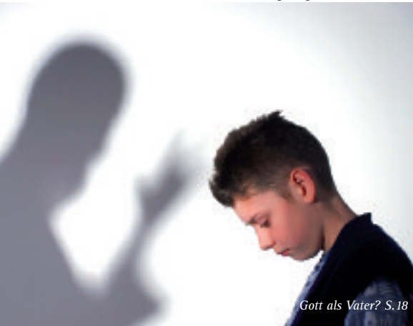
Gott als Vater? S.18