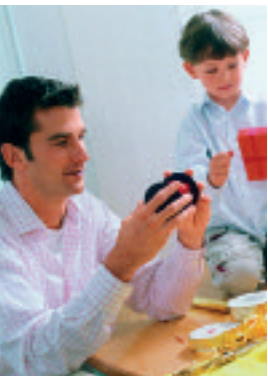
Familie praktisch, S.10