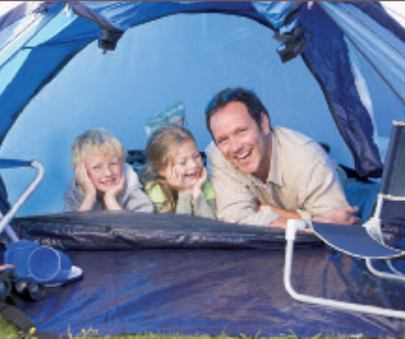
Camping zu dritt, S.4