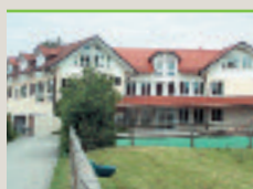
Hoffmannschule Wilhelmsdorf (Kreis Ravensburg)

Die folgenden Seiten geben Ihnen einen Überblick über unsere diakonischen Einrichtungen.