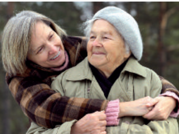
Wenn die Erinnerung langsam erlischt, S.14