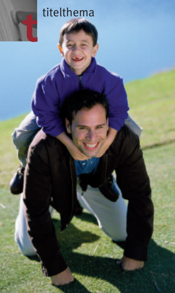
Der Höhepunkt für Kinder: Wenn der Vater einfach mal Zeit hat und man mit ihm so richtig Quatsch machen kann.