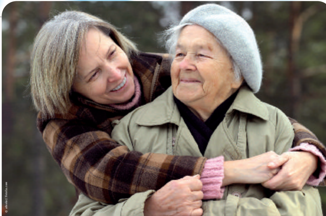
Auch wenn Verständigung über Worte kaum mehr möglich ist, bleibt die Gefühlswelt bis zuletzt erhalten – der demente Mensch empfindet intensiv.

Orientierungsstörungen beziehen sich auf Raum, Zeit und Personen. So weiß ein Mensch mit Alzheimer bald nicht mehr genau, welche Jahreszeit gerade ist, geschweige denn welches Datum. Er kann die Bedeu-