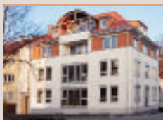
Familienzentrum des Flattichhauses

Wilhelmsdorfer Straße 8 70825 Korntal-Münchingen